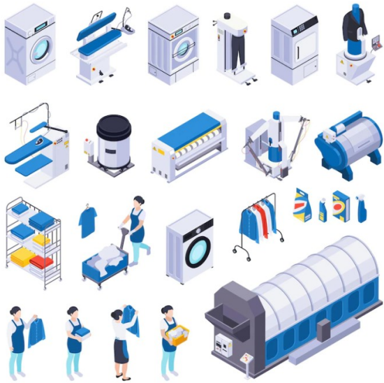
Wasserij wassen set isometrische pictogrammen met geïsoleerde menselijke karakters wasmachines wasmiddelen en rokplanken vectorillustratie | Gratis Vector (freepik.com)