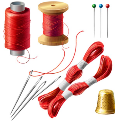
3d-realistische kleermaker set. houten haspel met draden, naalden en pinnen voor kleermakerij | Gratis Vector (freepik.com)

You are going Fine, but 'Everywhere and Nowhere you need some mending'.