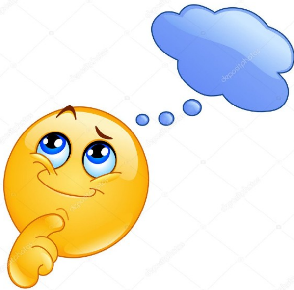
Denken emoticon vectorafbeelding door © yayayoyo ↓ Vectorstock #3643397 (depositphotos.com)